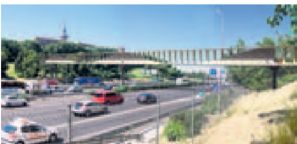
Pasarela polideportivo Elipa-Parque de Roma