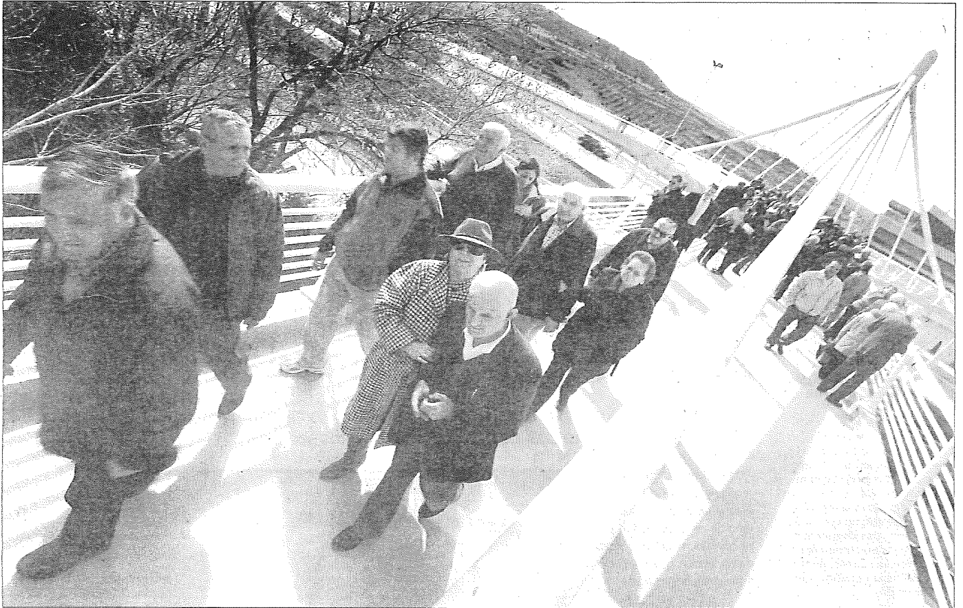
Fueron muchos los vecinos que no quisieron perderse la inauguración de la pasarela peatonal